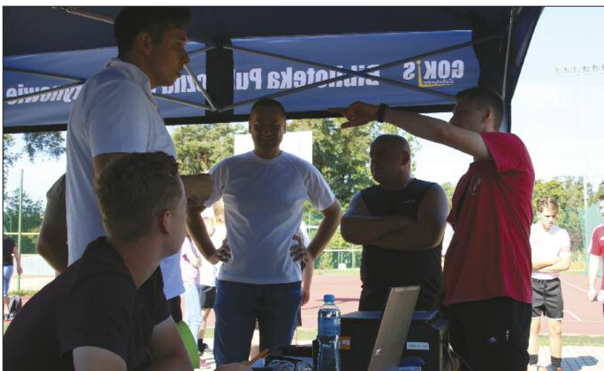
Sekretariat turnieju przyjmuje zapisy drużyn