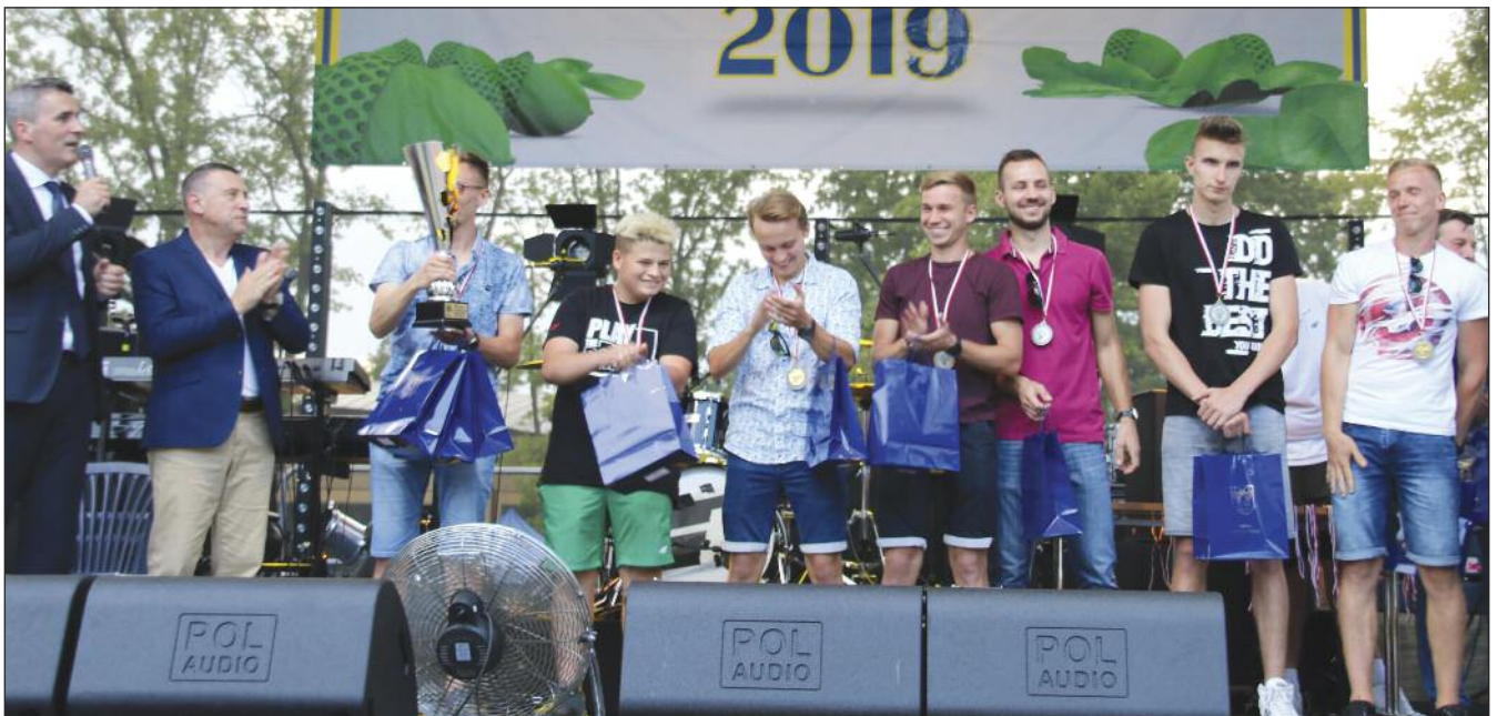
Drużyna z Ostrowa otrzymuje puchar