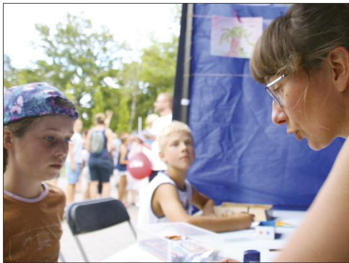
Warsztaty klimatyczne podczas Dnia Gminy

Prezentacja dotycząca zmian klimatu, lekcje dla uczniów szkoły podstawowej i gimnazjum, akcja oczyszczania ze śmieci terenu wokół komina starej cegielni, promocja zmiany nawyków konsumenckich to wydarzenia, którymi lokalna inicjatywa „Celestynów dla Klimatu” rozpoczęła cykl działań nastawionych na edukację mieszkańców gminy Celestynów w obliczu katastrofy klimatycznej oraz wspieranie działań na rzecz ochrony klimatu i zasobów Ziemi.